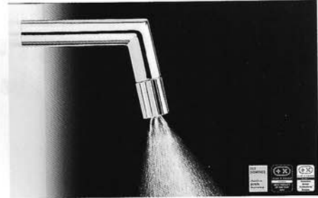
Swiss Eco Tap the acqua saver gewinnt den Plus X Award 2014

Die Astra Resources AG in Eglisau-Zürich entwickelt Innovationen unter dem Claim «we change energy and innovate power». Dem funktionalen, zeitlosen Design kommt dabei besondere Bedeutung zu. Die Produktionen erfolgen nach höchsten Qualitätsstandards. Sie werden auch national und international lizenziert.